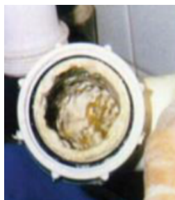
Rörsystem vid användning av pDCB-block.

Testresultaten visade att Bio Blocks effektivt höll urinalerna rena och rörsystemet fritt från blockeringar, vilket resulterade i betydande besparingar för kunden.